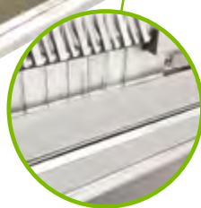
Option : WFCDL15DEF